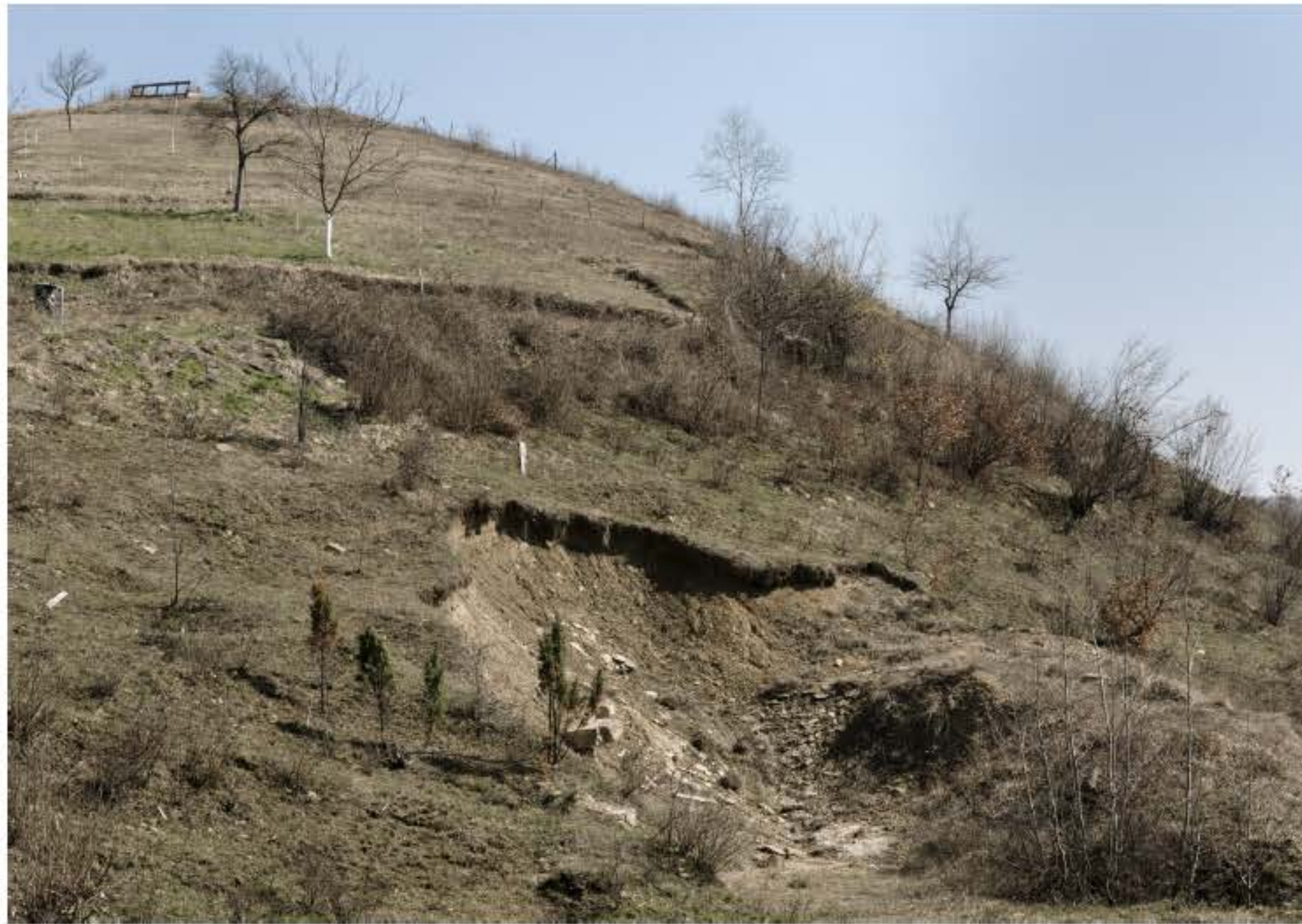
Boven: Vratnica Tumulus, een opgravingsplaats.