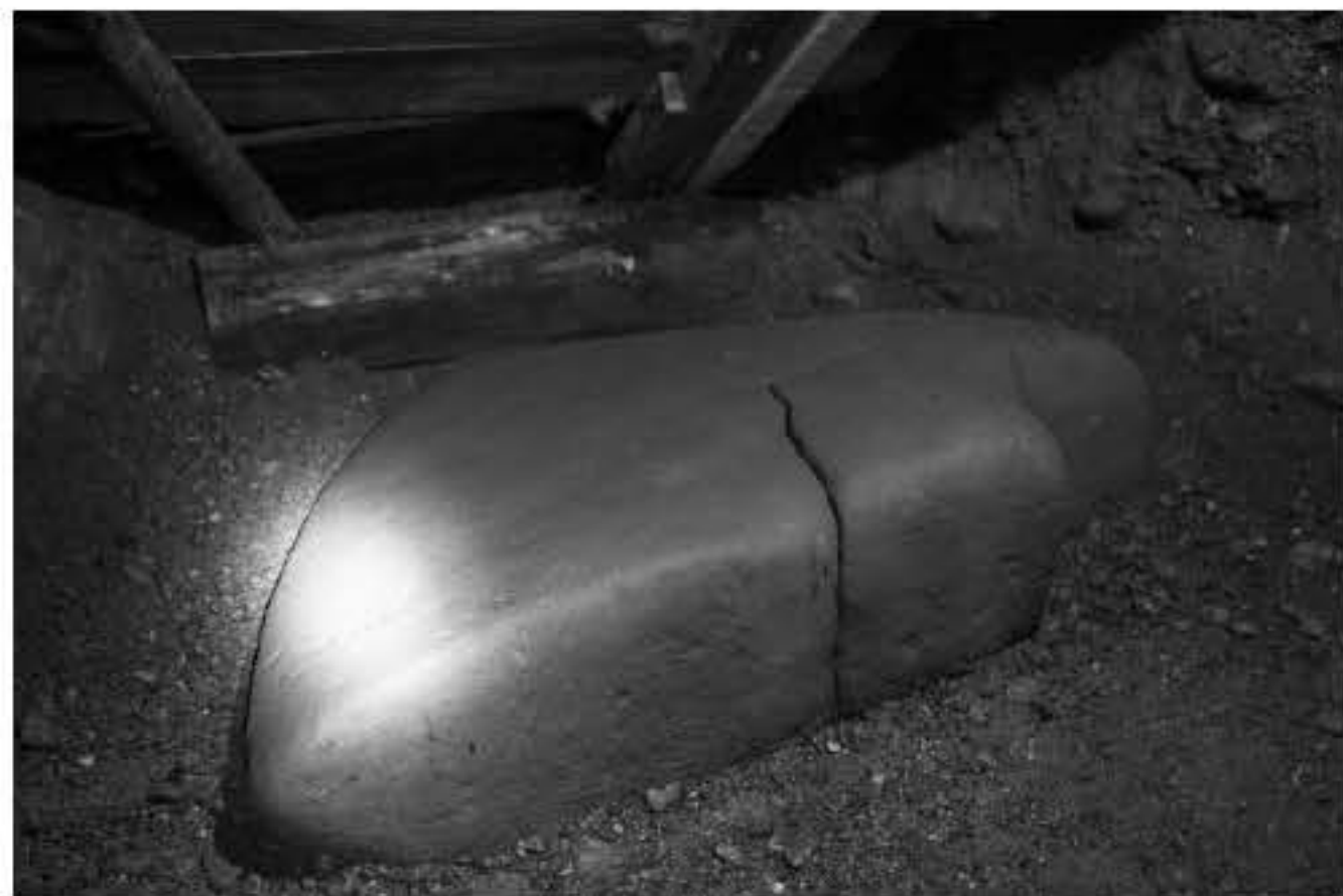
Rechts: Megaliet K1.