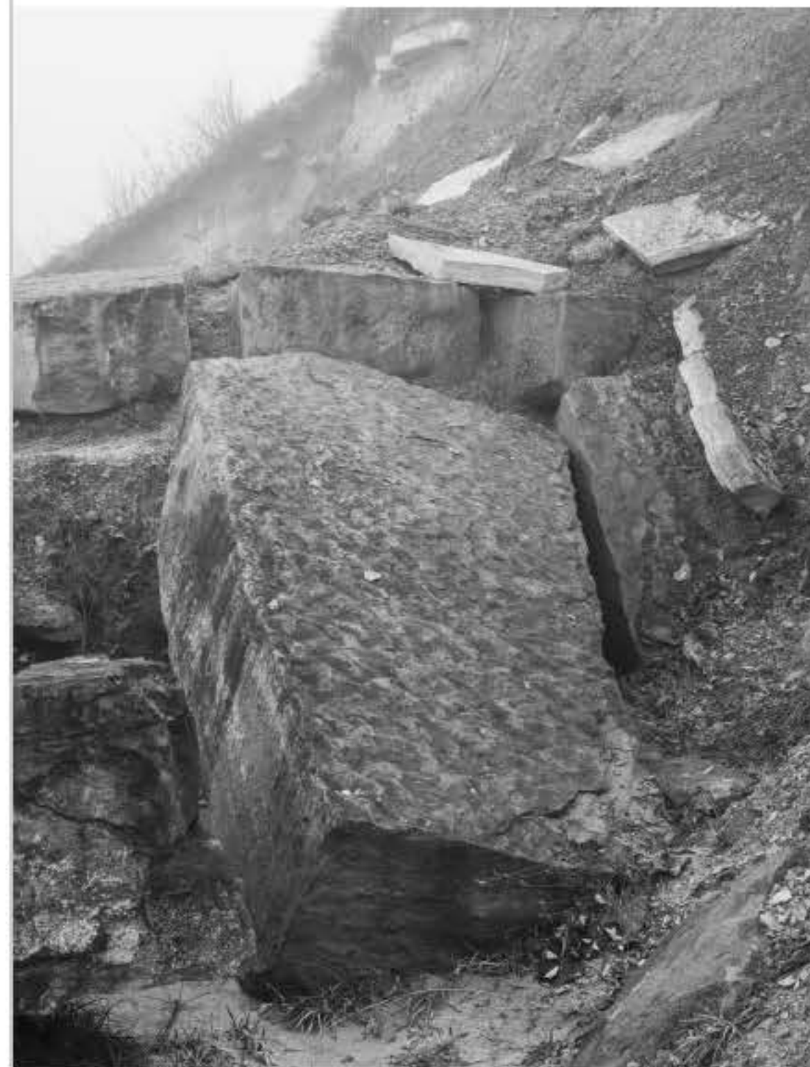
Boven: Gesneden steen, Vratnica Tumulus.