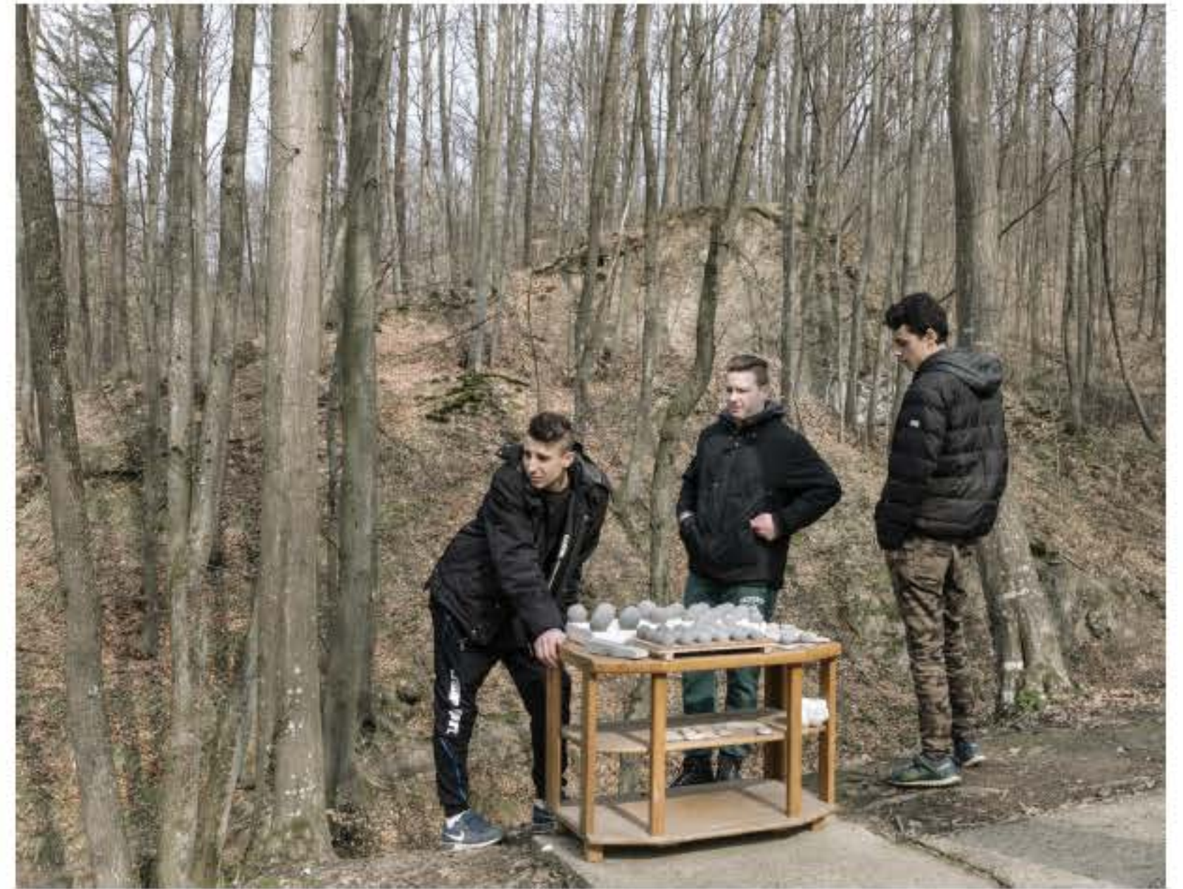
Boven: Een standje met souvenirs in Zavidovici.