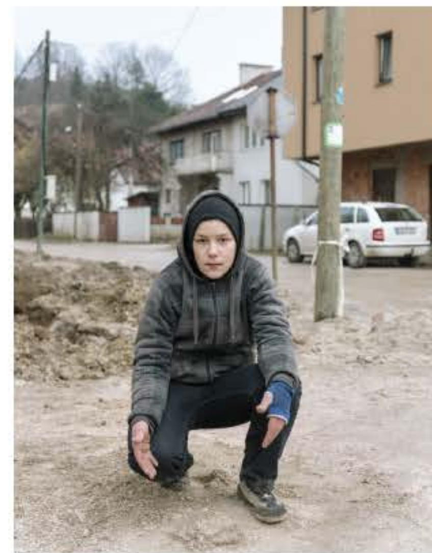
Rechts: Een kind knielend voor zijn 'minipiramide'.